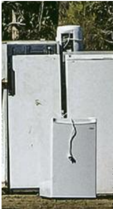
FOT. Zofia podglądowe

W dalszej części dobitnie wyraził swoją opinię w tej sprawie. – Uważam takie postępowanie za skandal. Ponieważ mieszkam w Zdunach, pokonałem trasę kilkunastu kilometrów, nie osiągając zamierzonego przeze mnie rezultatu. W drodze powrotnej miałem ochotę wjechać do lasu i porzucić tam lodówkę. Tylko moje poczucie kultury ekologicznej powstrzymało mnie od tego. Jednak moja złość i fru-