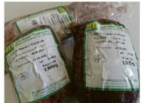
Wyroby wyróżnione tytułem TOP PRODUKT.