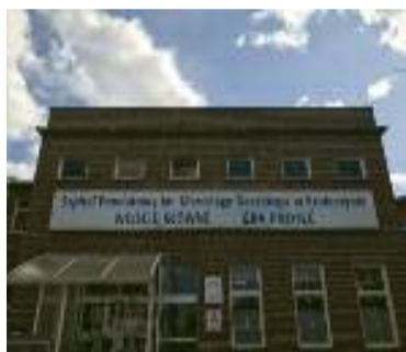
znajdować się będą cztery łóżka intensywnej terapii (respiratorowe). Chorzy leżący będą w budynku szpitala przy ul.

Jak poinformował krotoszyński szpital, w związku z decyzją wojewody wielkopolskiego, od 17 marca SPZOZ w Krotoszynie w swoich strukturach zobowiązany został do realizacji świadczeń opieki zdrowotnej w kwestii zapobiegania, przeciwdziałania i zwalczania COVID-19 poprzez zapewnienie 20 łóżek dla pacjentów z podejrzeniem lub potwierdzeniem zakażenia SARS-CoV-2.