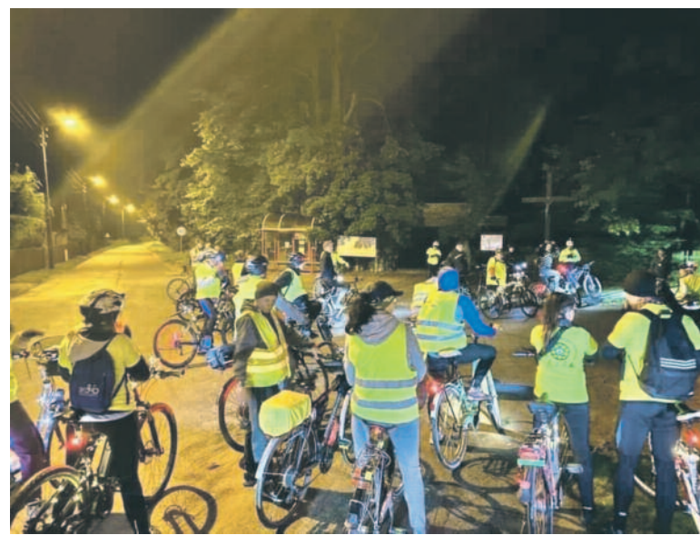
FOT: Aktywnie po Dolinie Baryczy

Miliccy cykliści ponownie zebraли się po zmroku, by wspólnie przemierzać gminne ścieżki i leśne dukty. Na II Nocny Rowerowy Rajd po Dolinie Baryczy wyruszyli w sobotę, 18 września, o godzinie 21.00.