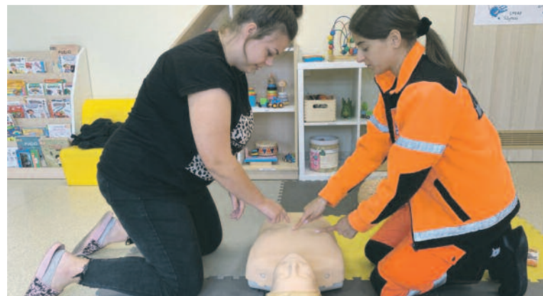
FOT. Ziobek „Słoneczko” w Krośnicach

18 września krośnicki żłobek „Słoneczko” zorganizował szkolenie z pierwszej pomocy przedmedycznej. Kurs prowadzili wykwalifikowani ratownicy z Oleśnicy, przekazując cenne wskazówki rodzicom i personelowi placówki.