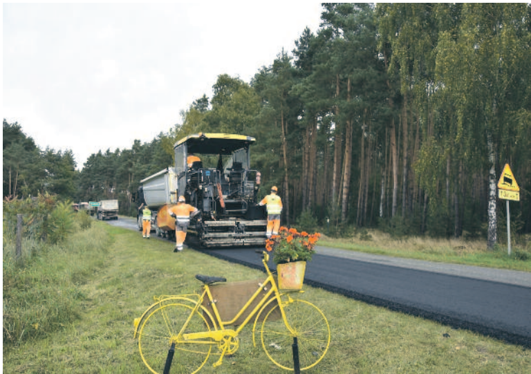
FOT. Gmina Milicz w powiecie milickim

23 września rozpoczęła się przebudowa drogi powiatowej, krzyżującej się z drogą wojewódzką nr 439. Remontowany będzie odcinek od miejscowości Sułów do granicy powiatu w Gruszczykach. Całkowity koszt inwestycji wyniesie ponad 1,2 miliona złotych. Do czasu zakończenia prac ruch w tym miejscu będzie odbywał się wahadłowo.