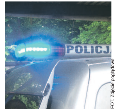
FOT. Zdj. poglądowe

Druga sprawa to kradzież roweru o wartości 1700 zł, do której doszło 13 września. Po zgłoszeniu przez właściciela pojazdu policjanci z Wydziału Kryminalnego podjęli działania. Uzyskali rysopis podejrzanego, a dzięki przejrzeniu nagrań