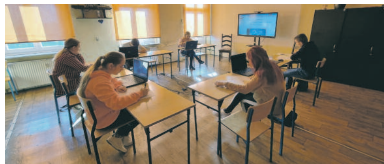
FOT: HP 15-2

W pierwszej części uczestnicy musieli rozwiązać test teoretyczny, a druga pole-