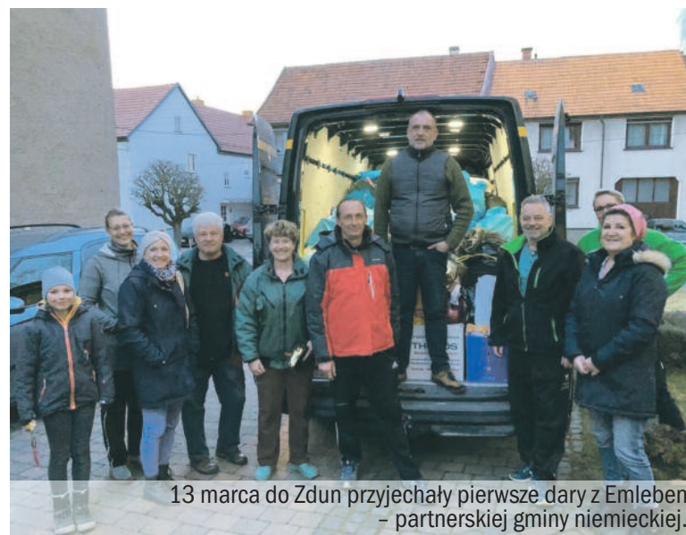
13 marca do Zdun przyjechały pierwsze dary z Emleben – partnerskiej gminy niemieckiej.

16 marca w pomieszczeniach po byłym sklepie SMAK na rynku w Rozdrażewie uruchomiono punkt pomocy humanitarnej dla obywateli Ukrainy. Jest on czynny w poniedziałki, środy i piątki, w godzinach 10.00-11.00 oraz 16.00-18.00. Można tam dostarczać żywność, artykuły higieniczne (m. in. pampersy, chusteczki nawilżone, podpaski, płyny i żele do mycia, itp.), artykuły chemiczne (m. in. proszek, mydło, papier toaletowy). W punkcie pomocy uchodźcy z Ukrainy mogą nieodpłatnie odbierać potrzebne artykuły. – Na bieżąco będziemy mieszkańców informować o najpilniejszych potrzebach obywateli Ukrainy, przebywających na terenie naszej gminy.