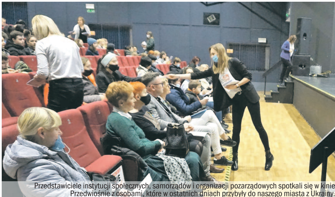
Przedstawiciele instytucji społecznych, samorządów i organizacji pozarządowych spotkali się w kinie Przedwiośnie z osobami, które w ostatnich dniach przybyły do naszego miasta z Ukrainy.