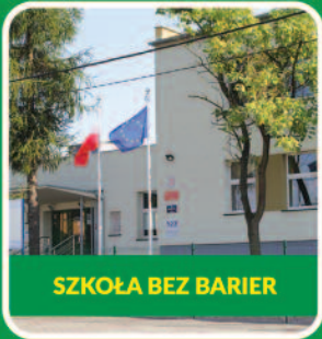
SZKOŁA BEZ BARIER