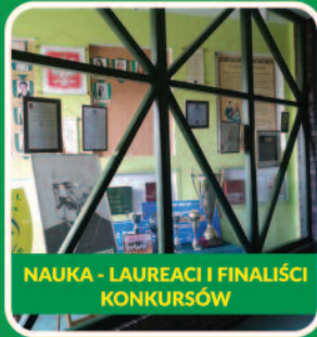
NAUKA - LAUREACI I FINALIŚCI KONKURSÓW