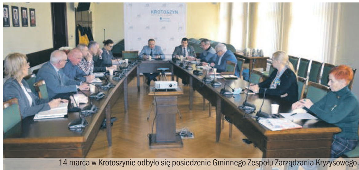
14 marca w Krotoszynie odbyło się posiedzenie Gminnego Zespołu Zarządzania Kryzysowego.

dojechała do Chelma, gdzie przekazane przez koźminian dary wykorzystano w punktach przy granicy oraz bezpośrednio w Ukrainie.