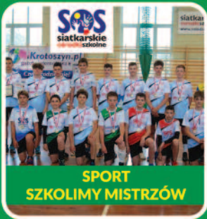
SPORT SZKOLIMY MISTRZÓW