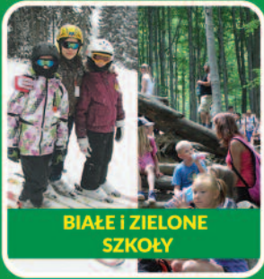
BIAŁE I ZIELONE SZKOŁY