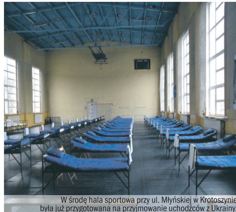
W środę hala sportowa przy ul. Młyńskiej w Krotoszynie była już przygotowana na przyjmowanie uchodźców z Ukrainy.