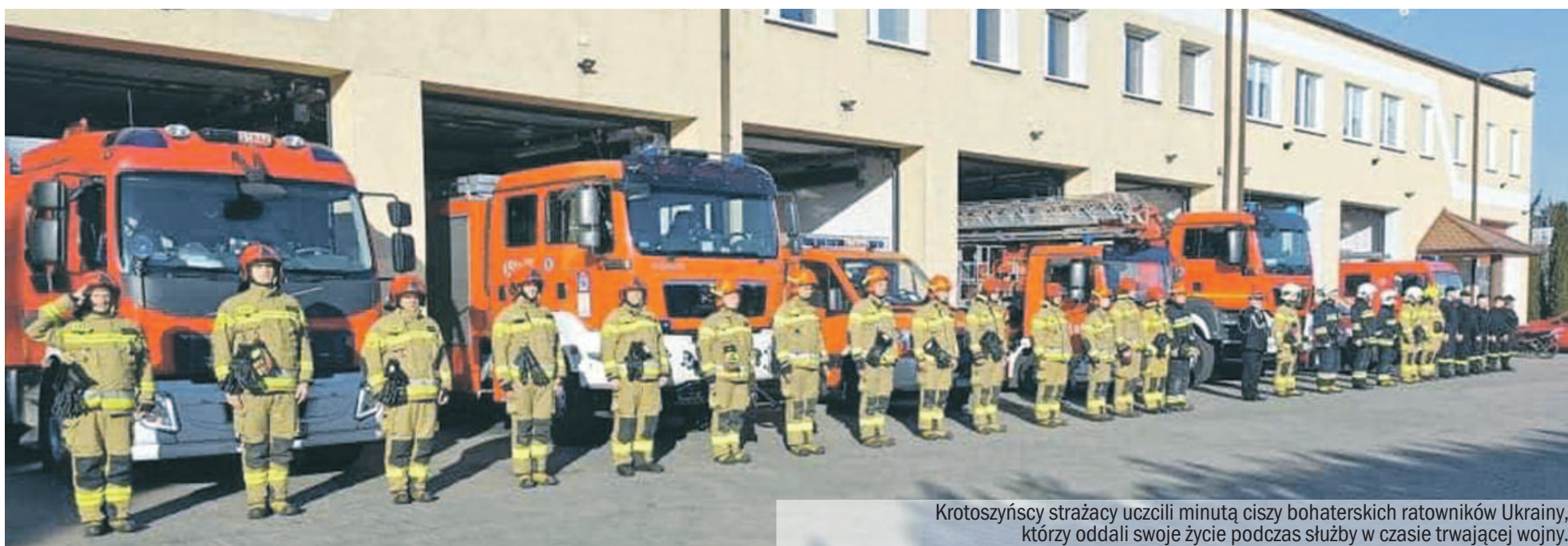
Krotoszyńscy strażacy uczcili minutą ciszy bohaterskich ratowników Ukrainy, którzy oddali swoje życie podczas służby w czasie trwającej wojny.