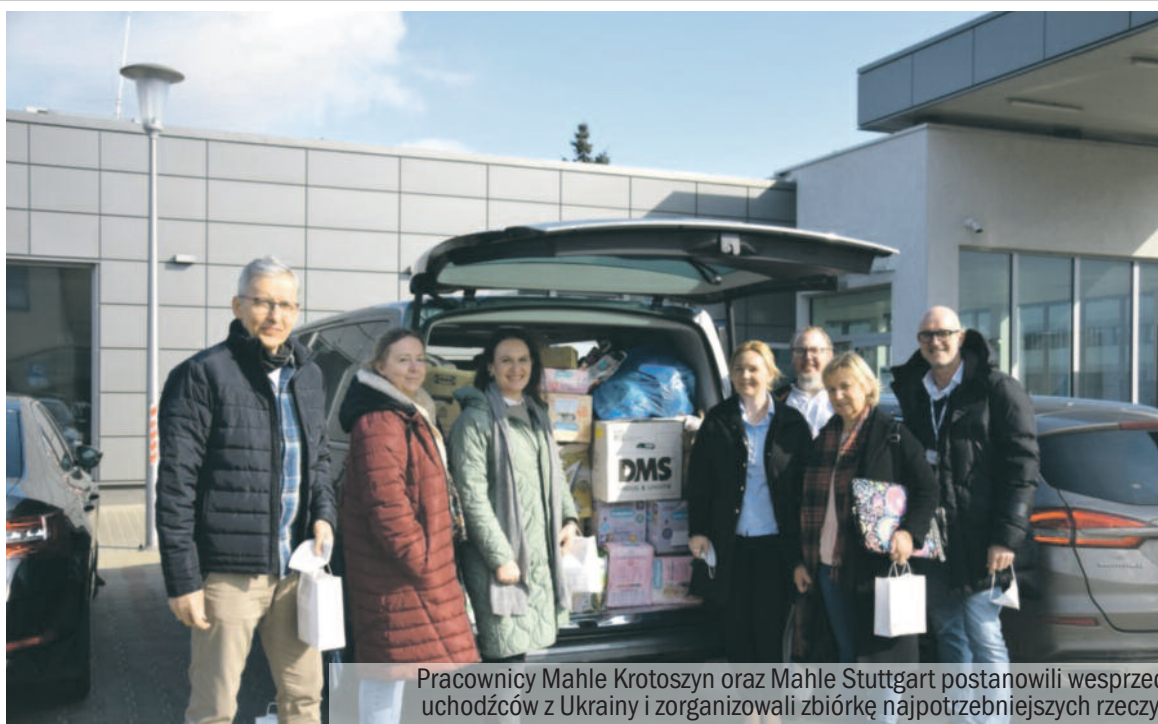
Pracownicy Mahle Krotoszyn oraz Mahle Stuttgart postanowili wesprzeć uchodźców z Ukrainy i zorganizowali zbiórkę najpotrzebniejszych rzeczy.

Przedstawiciele instytucji społecznych, samorządów i organizacji pozarządowych spotkali się w kinie Przedwiośnie z osobami, które w ostatnich dniach przybyły z Ukrainy, by przekazać im konkretne informacje w kwestii tego, na jaką pomoc mogą liczyć. Rozdano ulotki informacyjne. Dzieci ukraińskie już uczą się w krotoszyńskich