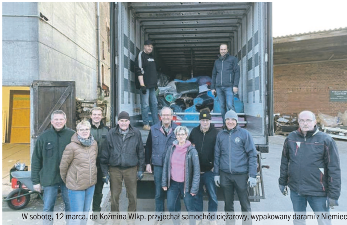
W sobotę, 12 marca, do Koźmina Wlkp. przyjechał samochód ciężarowy, wypakowany darami z Niemiec.

Tego samego dnia wieczorem harcerze i strażacy z OSP zapakowali ciężarówkę z darami, która nazajutrz