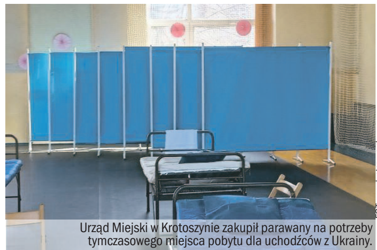
Urząd Miejski w Krotoszynie zakupił parawany na potrzeby tymczasowego miejsca pobytu dla uchodźców z Ukrainy.