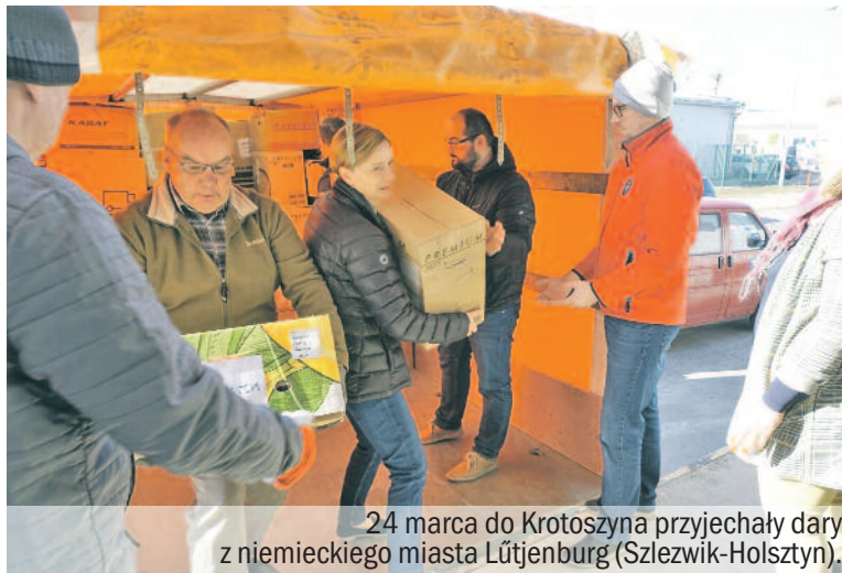
24 marca do Krotoszyna przyjechały dary z niemieckiego miasta Lütjenburg (Szlezwik-Holsztyn).

Rozładunku transportu złożonego z wypełnionych po brzegi dwóch