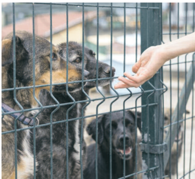
Fot. Zajęcie pogojowe

Rozdrażewscy radni przyjęli uchwałę w sprawie określenia „Programu opieki nad zwierzętami bezdomnymi oraz zapobiegania bezdomności zwierząt na terenie gminy na 2022 rok”.