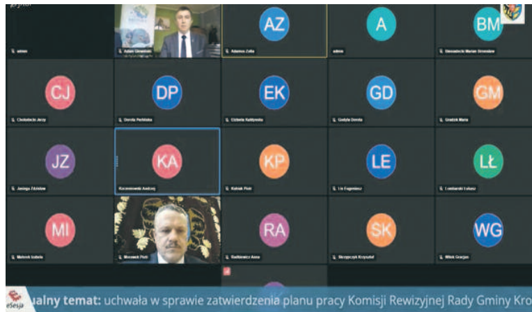
Temat: uchwała w sprawie zatwierdzenia planu pracy Komisji Rewizyjnej Rady Gminy Krośnice