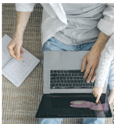
FOT. Zdjęcie poglądowe

Dofinansowanie na zakup sprzętu trafi do 1604 gmin z całej Polski, a łączna kwota przeznaczona na ten cel to 586 222 805 zł. W kraju złożono wnioski na ponad 215 tys. komputerów i laptopów oraz przeszło 3 tys. tabletów o łącznej