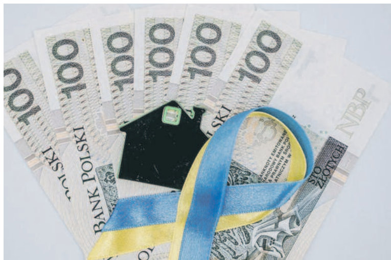
GRAFIKA: Gmina Milicz

Dużym echem w lokalnej społeczności odbił się komunikat władz gminy Milicz odnośnie braku wypłaty świadczeń dla osób fizycznych, które zapewniły zakwaterowanie i wyżywienie obywatelowi lub obywatelom Ukrainy (40 zł za osobę za każdy dzień pobytu). Urząd tłumaczy to nieprzekazaniem środków z funduszu pomocy przez Dolnośląski Urząd Wojewódzki we Wrocławiu. Ten z kolei twierdzi, że pieniądze są.