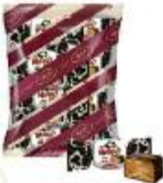
Who said Muuu? milk taste in chocolate

Wszystkie produkty "AVK" są certyfikowane zgodnie z normą międzynarodową ISO 9001 i 22000. W 2015 Certyfikat Halal przyznano ponad 120-u produktom z "AVK". Firma "AVK" obecnie eksportuje swoje produkty do ponad 30 krajów na całym świecie i jest otwarta na nowe rynki. Produkuje w markach własnych na zlecenie klienta.