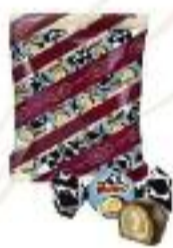
Who Said Muuu? wafers milk and vanilla taste