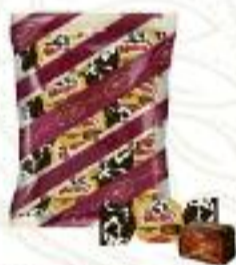
Who said muuu? Condensed milk