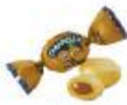
Caramella with taste apricot /o smaku moreli