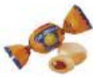
Caramella with taste orange /o smaku pomarańczy