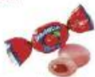
Caramella with taste cherry /o smaku wiśni

Oferta firmy obejmuje produkty czekoladowe typu: batony, czekolady, cukierki czekoladowe, herbatniki, ciastka, wafle, galaretki. Najpopularniejsze marki to "Królewski Masterpiece", "Who Said Muuu?", "2Galante", "Mr. BIGuin", "Trufalie", "Bomond" etc.