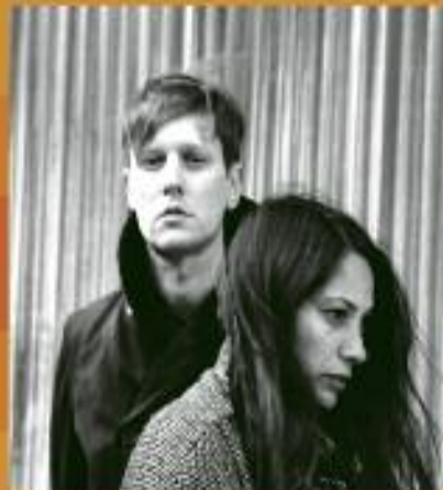
WILD ARROWS (USA)

bilety: 10 PLN / do nabycia w: kasa KOK / kasa KINO / online