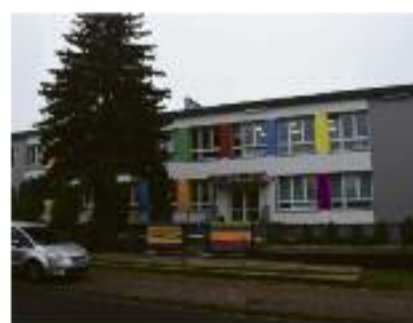
Dzięki dofinansowaniu ocieplony został budynek Szkoły Podstawowej nr 7 oraz Przedszkola nr 5.

prowadzono w cyklu dwuletnim. Modernizacja boiska kosztowała 301 tys. złotych, roboty w budynku szkolnym - 998 tys. złotych, z czego 847 tys. złotych stanowi pożyczka częściowo umarzalna uzyskana z Wojewódzkiego Funduszu Ochrony Środowiska i Gospodarki Wodnej 6 września br. w Chwaliszewie dokonano oficjalnego odbioru rozbudowanej części Domu Kultury. Obiekt zyskał dodatkowe pomieszczenie z sanitariatami, szatnią i zapleczem kuchennym, przebudowano także wejście do budynku. Koszt robót wyniósł ok. 240 tys. zł.