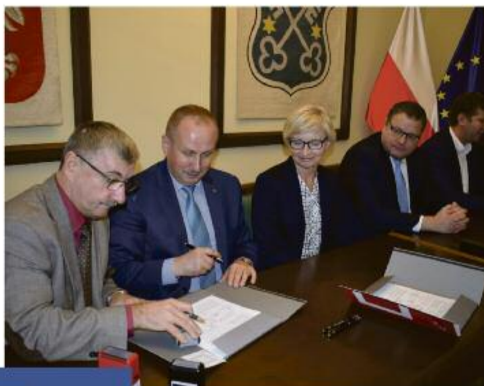
Burmistrz Krotoszyna podpisuje umowę na pożyczkę JESSICA 2 przy kontrasygnacie skarbnika gminy.

rekreacyjno-wypoczynkowego nad Jeziorem Odrzykowskim. Będą tam czekały na mieszkańców i gości: trasy spacerowa i rowerowa, nowoczesny skatepark, tor rowerowy, boiska sportowe, siłownia plenerowa, stok saneczkowy, plac zabaw w kształcie zagłowca. Zmodernizowany zostanie stadion, a nowy budynek pod trybunami będzie zapleczem dla wszystkich obiektów ośrodka. Przewidziano także pole namiotowe, parking. Przeprowadzone zostaną wszystkie niezbędne prace infrastruktury podziemnej. Póldziki obecnie obszar wokół zbiornika wodnego będzie kusił licznymi atrakcjami sportowo-rekreacyjnymi wg założeń już pod koniec 2020 roku. Do tego czasu powinna zostać także ukończona adaptacja na cele społeczne i kulturalne budynku kina Przedwiośnie. Wielofunkcyjna sala widowiskowa na parterze, dawniejsza sala klubowa, ułatwi organizację wielu wydarzeń dla różnych grup mieszkańców, pozwoli na ożywienie kulturalne środowisk, także seniorów. Przy tej okazji teren przy kinie zostanie przystosowany do prowadzenia imprez plenerowych.