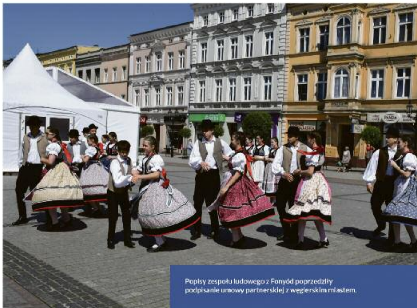
Popisy zespołu ludowego z Fonyód poprzedziły podpisanie umowy partnerskiej z węgierskim miastem.

Dzięki dobrej współpracy burmistrza z Urzędem Marszałkowskim, Oddziałem Wojewódzkim ZOSP RP i Komendą Powiatową PSP po raz pierwszy mieliśmy w naszym mieście obchody Wielkopolskiego Dnia Strazaka. Uroczystość odbyła się w maju na Rynku i w nowej hali sportowej. Nie była to jedyna impreza plenerowa zaproponowana mieszkańcom, jak zwykle znawcy muzyki gromadzili się na Rynku na Węgielnicach, a wielbicieli sztuki ulicznej przyciągnął Busker Bus. Dobrą siłą cieszy się coroczny Kratofest - Festiwal Aktywnych Sąsiadów, podczas którego w świątecznej formie prezentują się wszystkie organizacje pozarządowe działające na terenie naszej gminy. Gmina wspiera finansowo także wiele wydarzeń organizowanych przez kluby i stowarzyszenia, również coroczną imprezę prowadzoną przez Starostwo Powiatowe „Powiat od Kuchni”.