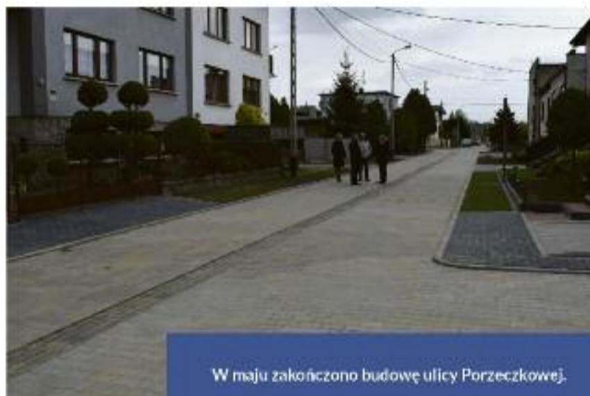
W maju zakończono budowę ulicy Porzeczkowej.

Do trwających obecnie inwestycji należą: przebudowa ponad 300-metrowej ulicy Wiśniowej w Orpiszewie i modernizacja systemu centralnego ogrzewania w Ratuszu. W przygotowaniu jest przetarg na przebudowę Wiejskiego Domu Kultury w Różopolu, na którą gmina uzyskała 320 tys. złotych dofinansowania z Programu Rozwoju Obszarów Wiejskich. W grudniu MZK Krotoszyn zaprosi nas na uroczyste otwarcie nowego placu manewrowego w zajezdni i prezentację 7 nowoczesnych autobusów. Razem z systemem biletowym i dwiema elektronicznymi tablicami informacyjnymi są to odcinki projektu realizowanego wspólnie z władzami powiatu - powiat zbudował ciągi pieszo-rowerowe. Cały projekt jest wart ponad 10 mln zł, część MZK - 7,1 mln, w tym dofinansowanie z WRPO - 4,9 mln zł.