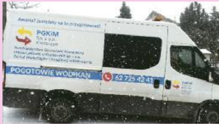
To zdjęcie, wykonane przez Gosię Kłopocką, zdobyło największą liczbę lajków. Tym samym jego Autorka wygrała główną nagrodę!

Zdjęcia nadesłane do 5 lutego, do godziny 15.00, udostępniłyśmy na naszym profilu facebookowym wraz z podaniem z imion i nazwisk ich autorów. Potem przez cztery dni (do 9 lutego, godz. 14.00) można było „lajkować” poszczególne fotografie. Zdjęcia przesłane po 5 lutego nie brały udziału w walce o główną nagrodę, ale ich autorzy mieli szansę na wygranie biletów do kina.