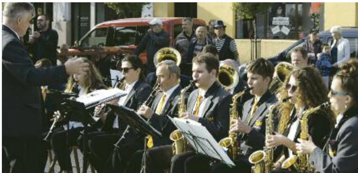
Krotoszyn. W Święto Flagi na rynku Krotoszyńska Orkiestra Dęta zagrała koncert pieśni patriotycznych.

W całym powiecie krotoszyńskim w pierwszych dniach maja zorganizowano szereg uroczystości w związku ze Świętem Flagi oraz kolejną rocznicą uchwalenia Konstytucji 3 Maja. Obchodzono także Dzień Strażaka. (NOVUS)