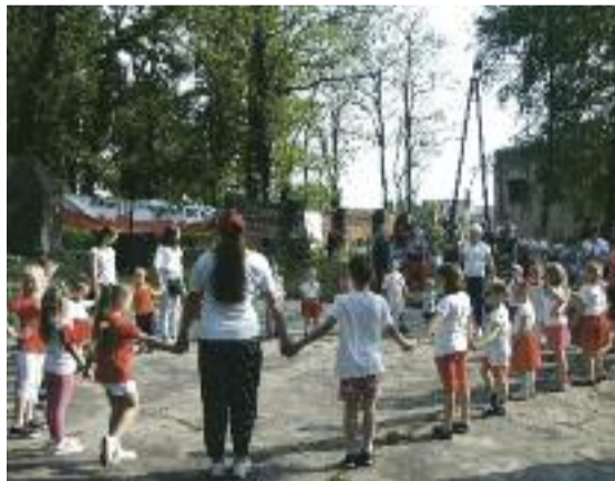
Zduny. W Święto Konstytucji 3 Maja odbyła się Zdunowska Majówka pod hasłem „Na harcerską nutę”.