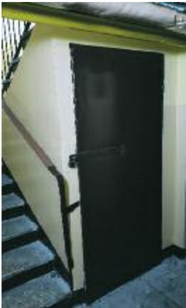
Tutaj mieściła się pierwsza siedziba firmy Daf-Mal.