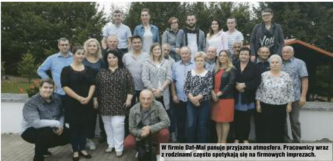
W firmie Daf-Mal panuje przyjazna atmosfera. Pracownicy wraz z rodzinami często spotykają się na firmowych imprezach.

Ciąg dalszy opowieści o firmie Daf-Mal już wkrótce!