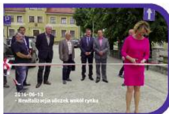
2016-06-13 - Rewitalizacja uliczek wokół rynku

Unowocześniamy i budujemy oświetlenie uliczne, wymieniamy oprawy na energooszczędne, oddajemy do użytku nowe place zabaw i otwarte siłownie. Od początku maja mieszkańcy Krotoszyna mogą poruszać się po mieście rowerem miejskim. Do tej pory (połowa września 2018) zarejestrowało się 1213 jego użytkowników, którzy skorzystali z niego 8 600 razy. Ze 180 osobami podpisano umowy na dofinansowanie zmiany systemów grzewczych na proekologiczne. W roku 2018 gmina przeznaczyła na ten cel 900.000 zł. Rozpoczęła się realizacja projektu o wartości ponad 8 milionów zł (z czego ponad 6 milionów to dofinansowanie z Wielkopolskiego Regionalnego Programu Operacyjnego na lata 2014-2020), który dotyczy odnawialnych źródeł energii. W kilkuset gospodarstwach gminy powstaną produkujące ekologiczny prąd ogniwa fotowoltaiczne, a mieszkańcy będą płacić mniejsze rachunki za prąd.