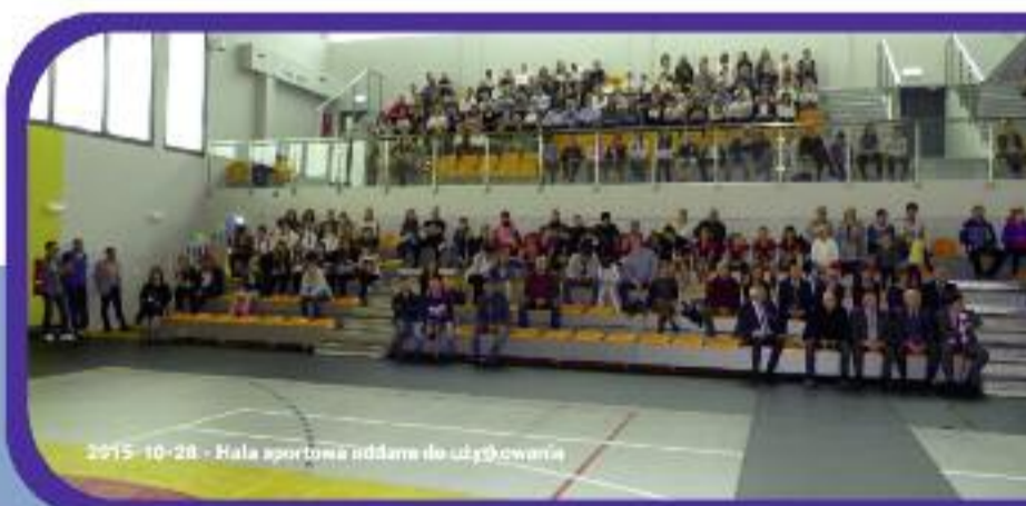
2015-10-28 - Hala sportowa oddana do użytkowania

Władze Krotoszyna są bardzo zainteresowane rozwojem współpracy z gminami partnerskimi w Europie i Azji. Jej głównymi beneficjentami są szkoły, a efekty to otwartość naszej społeczności na świat i ogromne rozszerzenie horyzontów poznawczych młodzieży i dorosłych. W trwającej już kilka dziesięcioleci współpracy uczestniczyło kilka tysięcy mieszkańców gminy.