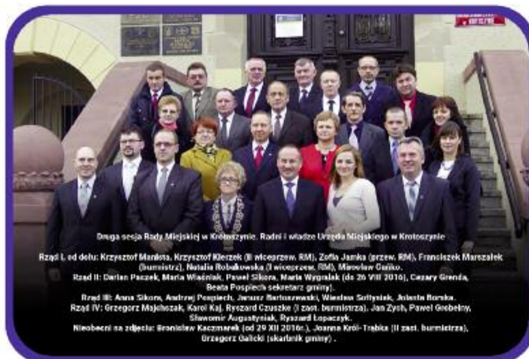
Cała sekcja Rady Miejskiej w Krotoszynie. Radni i władze Urzędu Miejskiego w Krotoszynie

W końcu sierpnia 2018 roku miał miejsce odbiór zmodernizowanego boiska sportowego przy Szkole Podstawowej nr 8. Dzięki dofinansowaniu z Programu Rozwoju Obszarów Wiejskich przebudowano Wiejski Dom Kultury w Różopolu. Trwa przebudowa i modernizacja świetlicy wiejskiej w Dzierżanowie. Dobięła końca budowa boiska wielofunkcyjnego Zespołu Szkół w Orpiszewie.