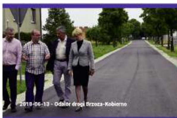
2018-06-13 - Odbiór drogi Brzoza-Kobierno