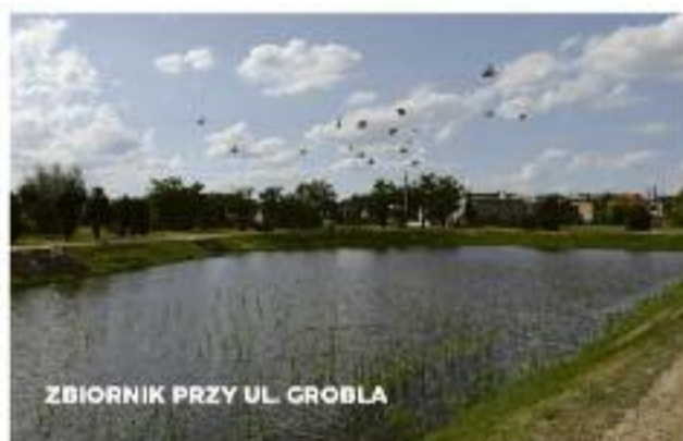
ZBIORNIK PRZY UL. GROBLA