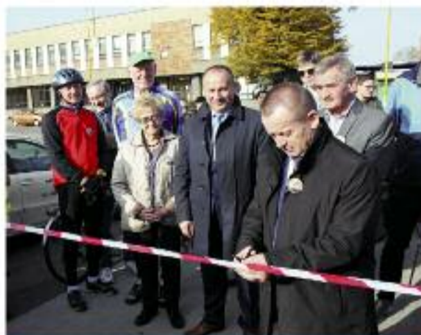
Odejęcie szablony do czystkowania i szablony szkolnej (wzrost) w szkole w Krotoszynie

Do bardziej istotnych inwestycji w ostatnich latach należały m.in.: budowa ciągów pieszo-rowerowych oraz remont nawierzchni wzdłuż ulicy Koszala w Krotoszynie i dalej - drogi w Henykwowie (gm. Różniów), przebudowa ulicy Cieszyńskiego w w. Koźminie Wlkp., przebudowa ulicy Stawnej w Krotoszynie, remont wraz z poszerzeniem istniejącej ścieżki wzdłuż drogi powiatowej Chuchalnia Krotoszyn, budowa ścieżki Hertwin-Baszków, re-