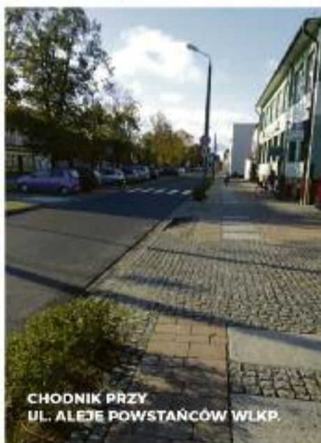
CHODNIK PRZY UL. ALEJE POWSTAŃCÓW WLKP.