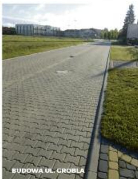
BUDOWA UL. GROBLA