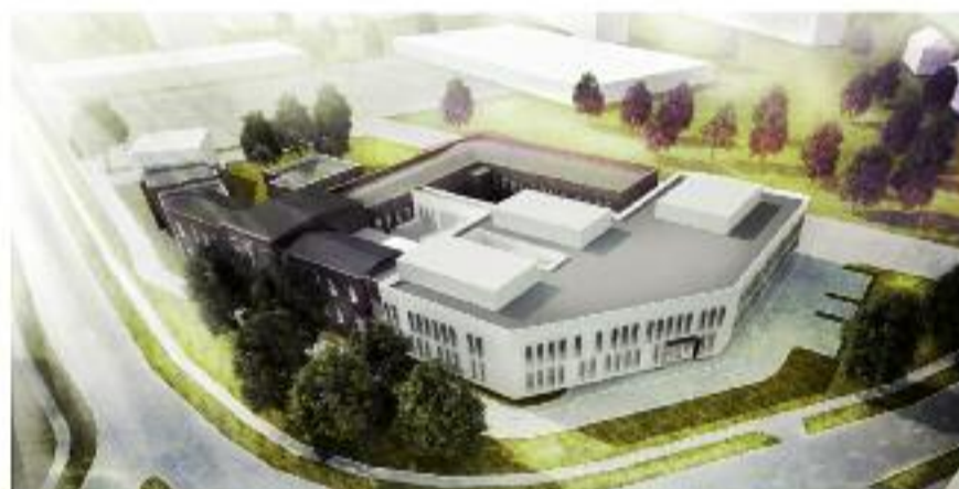
Tak będzie wyglądał Szpital Powiatowy im. M. Nieckiego w Krotoszynie po rozbudowie (wizualizacja)

Powiat krotoszyński ma jeden z najlepiej rozwinię-