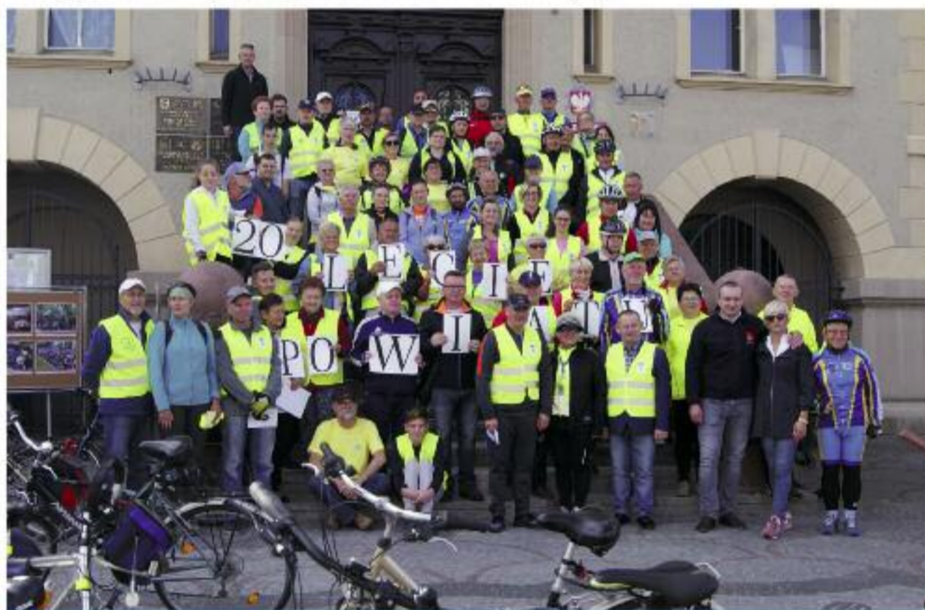
W cyklach rajdów rowerowych z okazji 20-lecia samorządu powiatowego udział wzięło ponad 400 osób

Czy wiesz, że? W powiecie krotoszyńskim działa ponad 300 stowarzyszeń – o 70 więcej niż przed czterema laty. To świadczy o rosnącej aktywności naszych mieszkańców. W latach 2015-2018 organizacjom pozarządowym powierzono realizację 127 zadań dofinansowanych ze kwoty ponad pół miliona złotych.