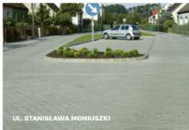
UL. STANISŁAWA MONIUSZKI