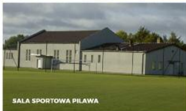
SALA SPORTOWA PIŁAWA