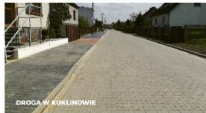
DROGA W KUKLINOWIE