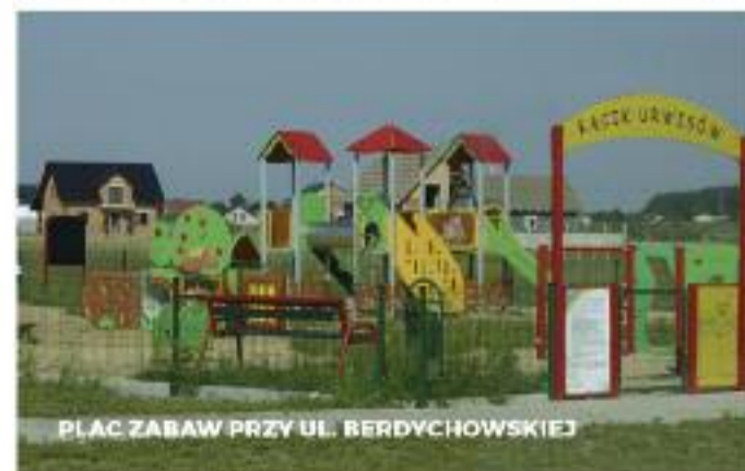
PLAC ZABAW PRZY UL. BERDYCHOWSKIEJ