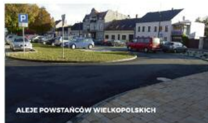
ALEJE POWSTAŃCÓW WIELKOPOLSKICH