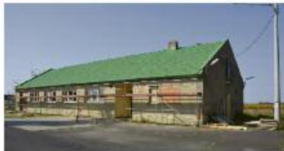
Remont świetlicy w Wyrębinie