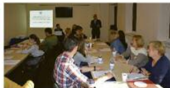
Z myślą o organizacjach społecznych organizowaliśmy szkolenia, których celem było podniesienie kompetencji i skuteczności w pozyskiwaniu środków finansowych z budżetu gminy i zewnętrznych.