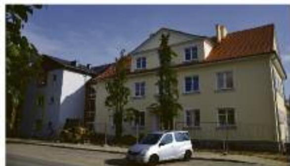
Przedszkole Parkowe Szkoła przy ul. Boreckiej