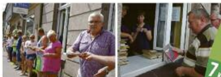
Spółdzielca obcy przetranszował książki do nowej siedziby biblioteki, przy ul. Zamkowej 2A

W latach 2014-2018 samorząd współpracował z: