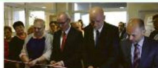
Otwarcie Biblioteki Publicznej