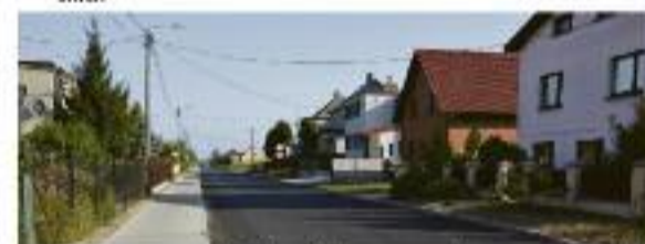
Ulica Cieszyńskiego po remoncie

Podniesienie jakości życia osób niepełnosprawnych i wykluczonych społecznie poprzez: wspieranie rozwoju Zakładu Aktywności Zawodowej i Spółdzielni Socjalnej „WYO” wykup gruntów pod budowę mieszkań chronionych w Koźminie Wielkopolskim