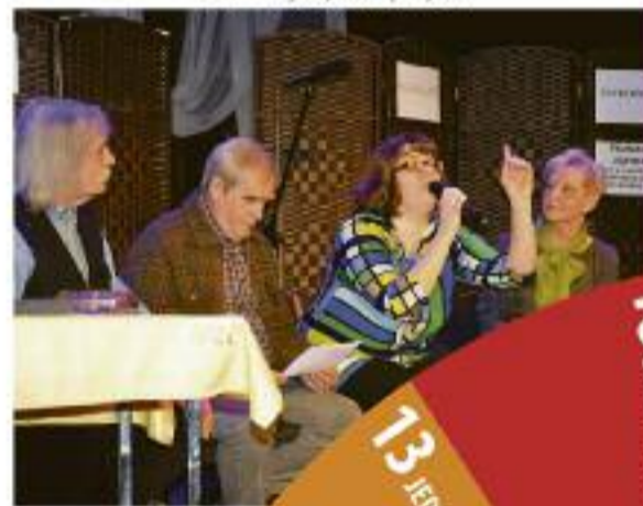
Teatr Seniora w Koźminie Wielkopolskim