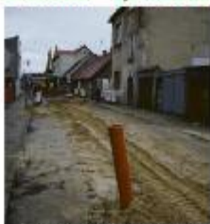
Wymiana kanalizacji przy ul. Glinki