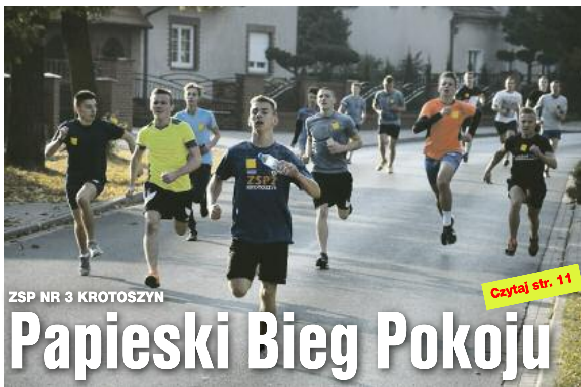
ZSP NR 3 KROTOSZYN

Darterski Puchar Polski w Perzycach Czytaj na str. 16