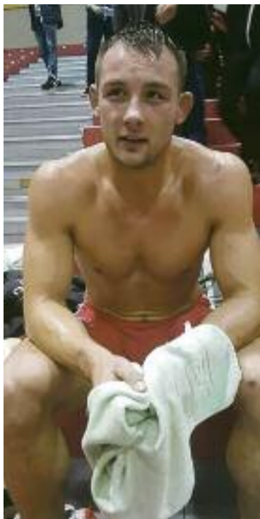
czy na macie. W związku z tym już przygotowuje się do sezonu.