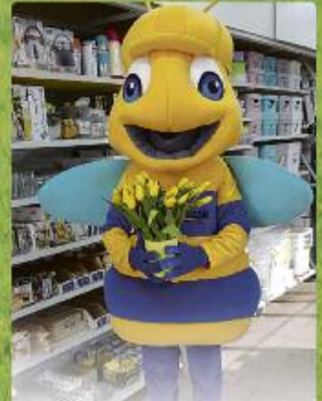
AGD, a także wszystko, co potrzebne do ogrodu.