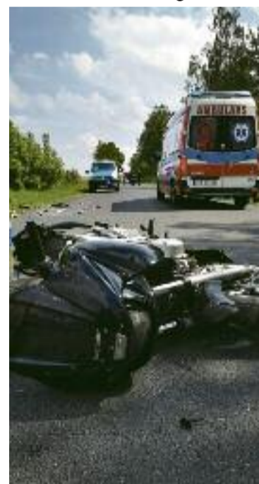
Krotoszyn, dn. 11.05.2019 r. (OSP Zduny)

Po zabezpieczeniu terenu działali strażacy przystąpili do udzielania poszkodowanemu kwalifikowanej pierwszej pomocy, polegającej na stabilizacji kręgosł-