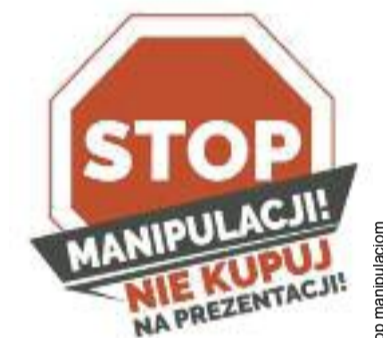
FOT. Stop manipulacjom

Aby przeciwdziałać tym nieetycznym i skandalicznym praktykom, Stowarzyszenie Manko – Głos Seniora oraz Fundacja FAST rozpoczęły kampanię „Stop manipulacji, nie kupuj na pre-