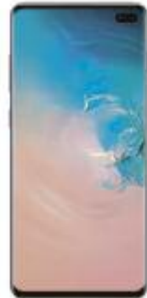
SAMSUNG Galaxy S10+