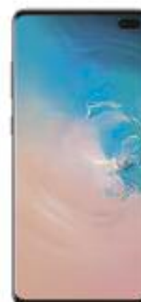
SAMSUNG Galaxy S10+