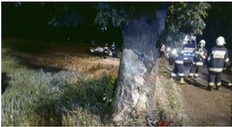
FOT. PSP Krotoszyn

4 sierpnia krótko po północy na drodze między Starkówcem a Łagiewnikami (gmina Kobylin) doszło do groźnego wypadku. W wyniku uderzenia samochodu w drzewo uszkodowana została jedna osoba.