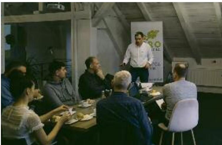
Goście z Litwy z wizytą w Agrointegracji.

Jedną z innowacji jest słynny już projekt Futter Nova 11. Jest to odpowiedź na brak paszy objętościowej i związane z tym problemy w zakresie ograniczeń w produkcji mlecznej i wołowej. Ów projekt został rekomendowany i dofinansowany przez Agencję Restrukturyzacji i Modernizacji Rolnictwa i jest w czołówce projektów innowacyjnych w rankingu sieci SIR (sieć na rzecz innowacji rolnej). – Spotkałmy się w ministerstwie rolnictwa z przedstawicielami wszystkich instytutów branżowych i uczelni oraz ośrodków doradztwa, działających w obszarze polskiego rolnictwa. Na bazie tych rozmów doszło już między nami do połączeń sieciowych, w rezultacie cze-