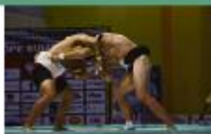
Poland Open 2019 (sumo) sms o treści IMP.2 na numer 72051

Jego praca i ogromne zaangażowanie, które wkłada w treningi, powodują, że zawodnicy UKS Shodan Zduny osiągają liczne sukcesy nie tylko na arenie krajowej, ale również międzynarodowej. Daje przykład swoim podopiecznym, zdobywając medale niemal na każdej imprezie. W ubiegłym roku m.in. zwyciężył w kata masters +40 lat na Karate Grand Prix Ostrawa 2019, a także zajął trzecie miejsce w International Karate Tournament Black Belt Cup 2019 we Włoszech.