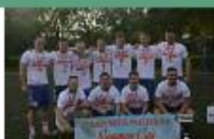
Summer Cup (piłka nożna) sms o treści IMP.5 na numer 72051

Jego dobra passa sportowa wciąż trwa. Włosną najpierw w 28. Halowych Mistrzostwach Polski w Lekkiej Atletyce Masters w Toruniu zdobył dwa złote krawki, a później wywalczył tytuł mistrza świata w pchnięciu kulą oraz wicemistrza w rzucie dyskiem w Halowych Mistrzostwach Świata Masters w Lekkiej Atletyce. We wrześniu wziął udział w Mistrzostwach Europy Masters w Lekkiej Atletyce, które odbyły się we Włoszech, gdzie wywalczył srebro w pchnięciu kulą, a w trzech innych konkurencjach uplasował się tuż za podium.