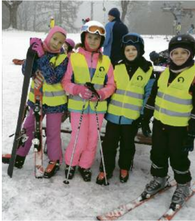
FOT. SP 1 Koźmin Wlkp.

Bardzo dobre warunki – naturalnie naśnieżone stoki, temperatura -3 stopnie Celsjusza, bezwietrzna oraz słoneczna aura – sprawiły, że czas szybko upływał, a dzieci aktywnie wypoczywały, zapominając o trudach roku szkolnego. W czwartym dniu mogły skorzystać również z kąpieli w aquaparku w Libercu. Wszyscy zadowoleni i wypoczęci wrócili bezpiecznie do domów.