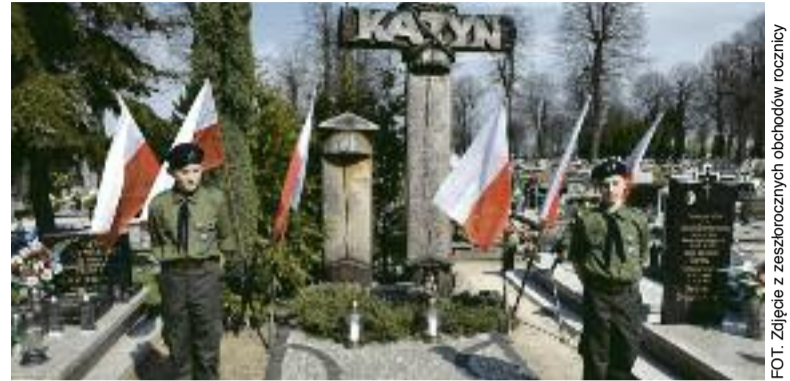
FOT. Zdjęcie z zeszytu rocznic obchodów rocznicy

Miejscami kaźni Polaków były miejscowości: Katyni – od 3 kwietnia do 12 maja rozstrzelano tam ok. 4400 jeńców z obozu w Kozielsku, Charków – od 5 kwietnia do 12 maja zamordowano tam ok. 3800 jeńców z obozu w Starobielsku, Kalinin (Twer) – od 4 kwietnia do 16 maja przeprowadzono tam egzekucje na ok. 6300 więźniach obozu w Ostaszkowie (głównie policjantach i funkcjonariuszach KOP), Kijów, Charków oraz Chersoń – wymordowano tam 3435 jeńców z tzw. listy ukraińskiej, więzionych we Lwowie, Łucku, Równem, Tarnopolu,