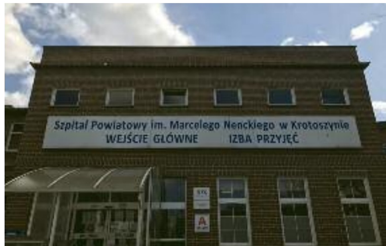
Opieki Paliatywnej i Zakład Opiekuńczo-Leczniczy przy ul. Bolewskiego.

łach szpitalnych nadal jednak obowiązuje zakaz odwiedzania chorych, co jest podyktowane względami bezpieczeństwa. Przypomnijmy, że wcześniej pracę wznowiły Oddział Rehabilitacyjny z Pododdziałem Rehabilitacji Neurologicznej w Koźminie Wlkp., Oddział Chirurgiczny z Pododdziałem Urazów Narządów Ruchu i Ortopedii oraz Oddział Anestezjologii i Intensywnej Terapii w szpitalu przy ul. Mickiewicza. Na wznowienie działalności czekają jeszcze Zakład