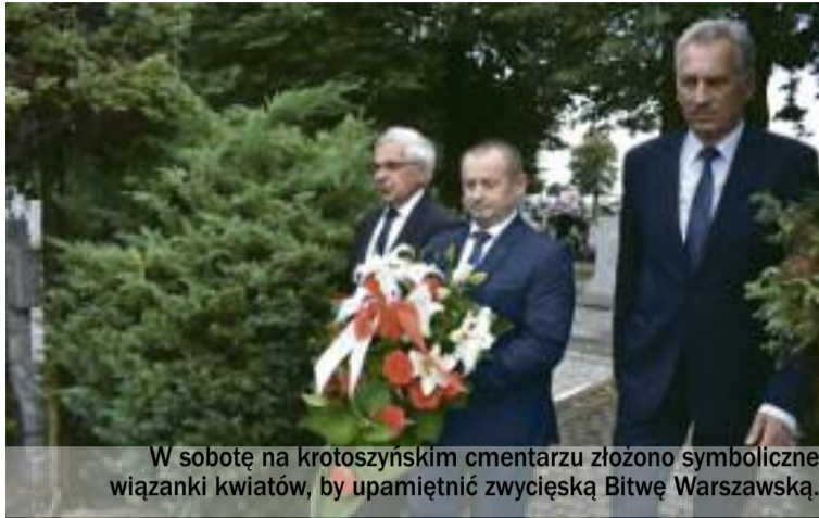
W sobotę na krotoszyńskim cmentarzu złożono symboliczną wiązankę kwiatów, by upamiętnić zwycięską Bitwę Warszawską.

Z kolei przedstawiciele kobylińskiego samorządu złożyli kwiaty i zapalili znicze przy pomniku poświęconym Poległym i Pomordowanym. Co roku, przy okazji corocznego Biegu im. Marszałka Józefa Piłsudskiego, składane były też wiązanki kwiatów przy pamiątkowej tablicy na ratuszu oraz na grobie Mieczysława Gierdala w Smolicach.