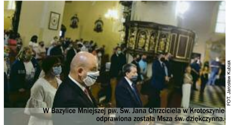
W Bazylice Mniejszej pw. Św. Jana Chrzyciela w Krotoszynie odprawiona została Msza św. dziękczynna.

rowany do Bobrujska, a następnie, już jako 56. Pułk Piechoty Wielkopolskiej, przebywał i walczył nad Berezyną i Ptyczą. W bitwie warszawskiej późniejszy krotoszyński pułk wchodził w skład 14. Dywizji Piechoty i znalazł się na lewym skrzydle grupy uderzeniowej znad Wieprza. Podczas manewru oskrzydłającego Armię Czerwoną pułk szedł przez Kletnicę, Kobuzy, Łaskrzew i wziął udział w krwawych walkach o Kołbiel pod Mińskiem Mazowieckim. Następnie przez miejscowości Nur, Czyżew i Zambrów dotarł – 24 sierpnia – do granicy Prus Wschodnich i został przetransportowany do Brześcia Litewskiego. Stamtąd żołnierze ruszyli do walki pod Kobryniem, Łaskowem. 17 września, po ciężkim starciu, odnieśli zwycięstwo w rejonie Berezki i Bosiszki, zdobywając Baranowicze, Snów i – przemierzając trakt miński – sforsowali