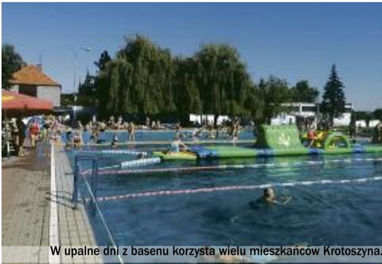
W upalne dni z basenu korzysta wielu mieszkańców Krotoszyna.

Poza tym przed wejściem na obiekt trzeba poddać się obowiązkowej dezynfekcji rąk, a wchodząc, każdy musi mieć zasłonięte usta i nos. Zresztą o tych zasadach, jak wspomina szef CSiR Wodnik, mają obowiązek przypominać wszyscy pracownicy, gdy wymaga tego sytuacja. Prezes jednak przyznaje, iż takie inter-