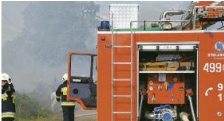
FOT. Archiwum (zdjęcia podglądowe)

Pożar zagrażał obiektom rolniczym, więc na miejsce skierowano dużą ilość sił