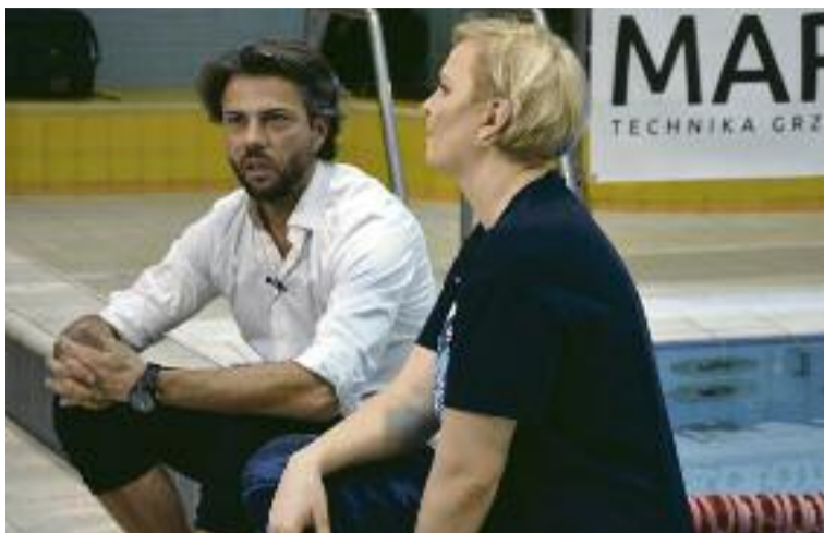
W 2019 roku gośćmi specjalnymi maratonu pływackiego byli Otylia Jędrzejczak i Olivier Janiak.