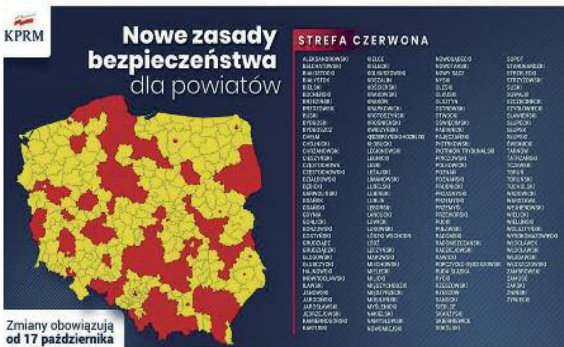
Zmiany obowiązują od 17 października

W środę w naszym powiecie osiem nowych przypadków zarażenia