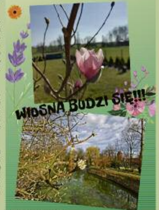
GRAFKA SP 1 Koźmin Wlkp.