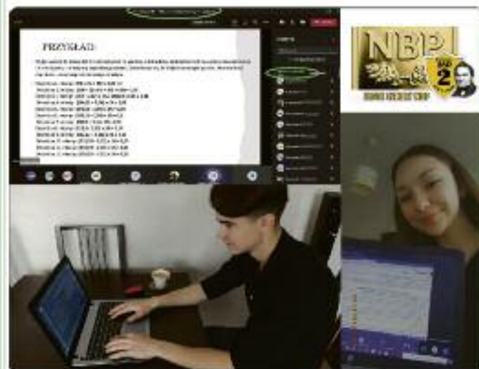
FOT. Ambasadorzy i edycji „Złotych Szkół NBP”