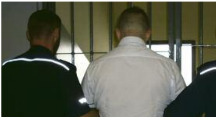
(zdjęcie poglądowe)

12 maja oficer dyżurny krotoszyńskiej policji otrzymał zgłoszenie dotyczące kradzieży artykułów kosmetycznych o wartości 699,97 złotych. Doszło do tego w jednej z drogerii w Krotoszynie. – Uwagę pracowników sklepu zwrócił mężczyzna, który zachowywał się bardzo nerwowo, po czym przekroczył linię kas, gdzie został ujęty przez pracownika ochrony. Przybyli na miejsce policjanci odzyskali skradziony towar, który w nienaruszonym stanie zwrócono drogerii – informuje Piotr