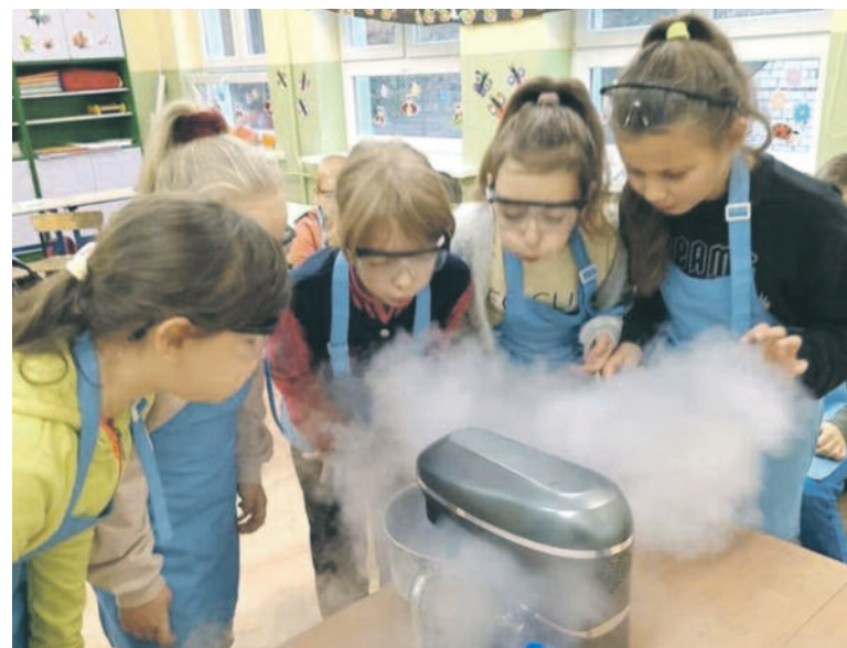
(zofjcie poglądowe)

Do wyboru mają m. in. stoły warsztatowe lub stolarskie wraz z nakładkami