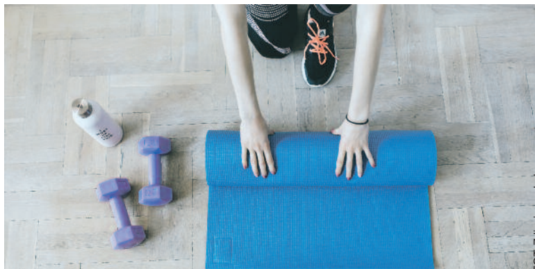
FOT. Zdjęcie pogiędowe

Milickie Stowarzyszenie Przyjaciół Dzieci i Osób Niepełnosprawnych ogłosiło, że realizuje projekt pod nazwą „Zdrowy tryb życia”. Zadanie dofinansowane jest ze środków gminy.