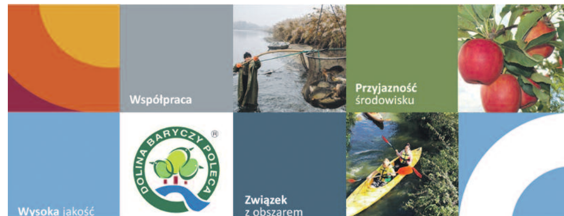
GRAFIKA: Dolina Baryczy Poleca

Do 21 lutego branże usługowe oraz producenci lokalnych produktów mają szansę ubiegać się o certyfikat „Dolina Baryczy Poleca”. Koordynatorem projektu jest Stowarzyszenie „Partnerstwo dla Doliny Baryczy” w Miliczu.