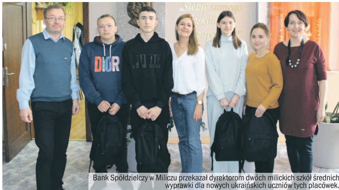
Bank Spółdzielczy w Miliczu przekazał dyrektorom dwóch milickich szkół średnich wyprawki dla nowych ukraińskich uczniów tych placówek.