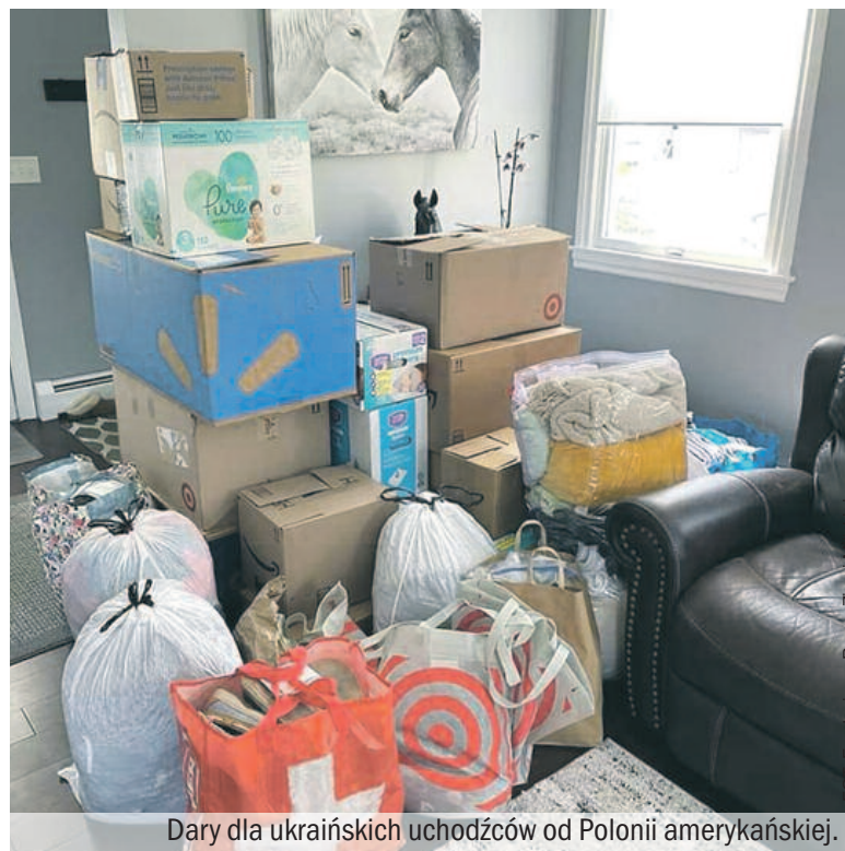
Dary dla ukraińskich uchodźców od Polonii amerykańskiej.