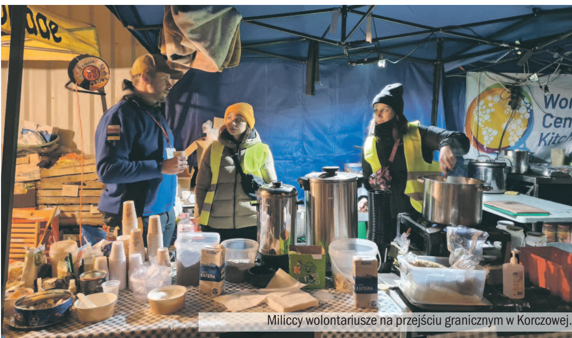
Miliccy wolontariusze na przejściu granicznym w Korczowej.

* W piątek Starostwo Powiatowe w Miliczu otrzymało pomoc z Rządowej Agencji Rezerw Strategicznych w postaci łóżek, koców, pościeli dla uchodźców z Ukrainy. Starosta Sla-