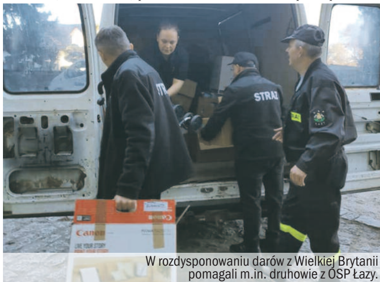
W rozdysponowaniu darów z Wielkiej Brytanii pomagali m.in. druhowie z OSP Łązy.

Do gminy Milicz dotarły kolejne podziękowania z ukraińskiej ziemi. Podziękowania, nadesłane zarówno