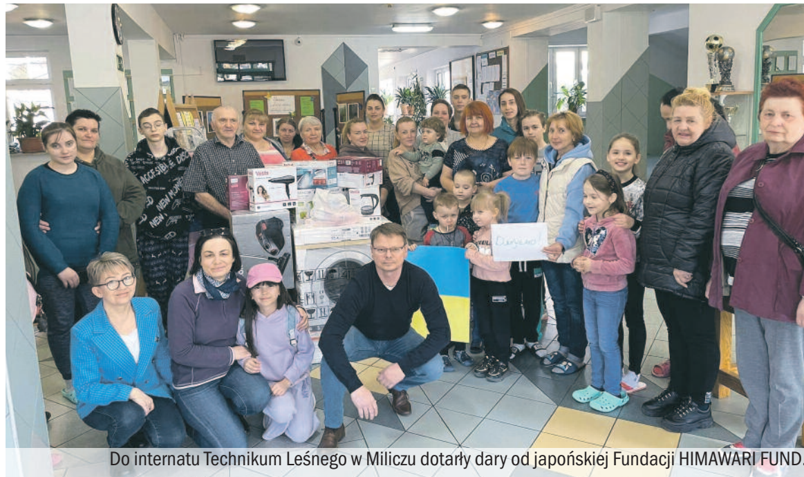
Do internatu Technikum Leśnego w Miliczu dotarły dary od japońskiej Fundacji HIMAWARI FUND.