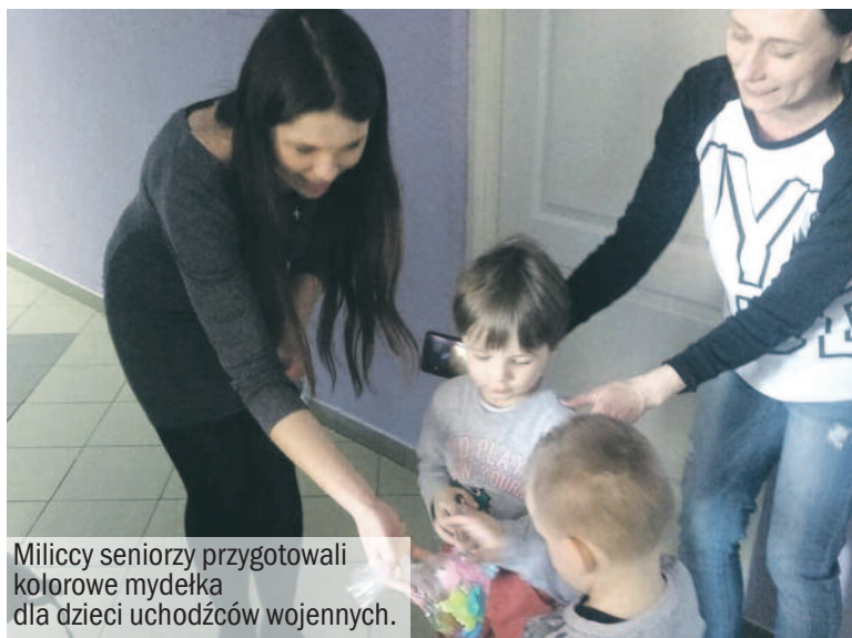
Miliccy seniorzy przygotowali kolorowe mydelka dla dzieci uchodźców wojennych.