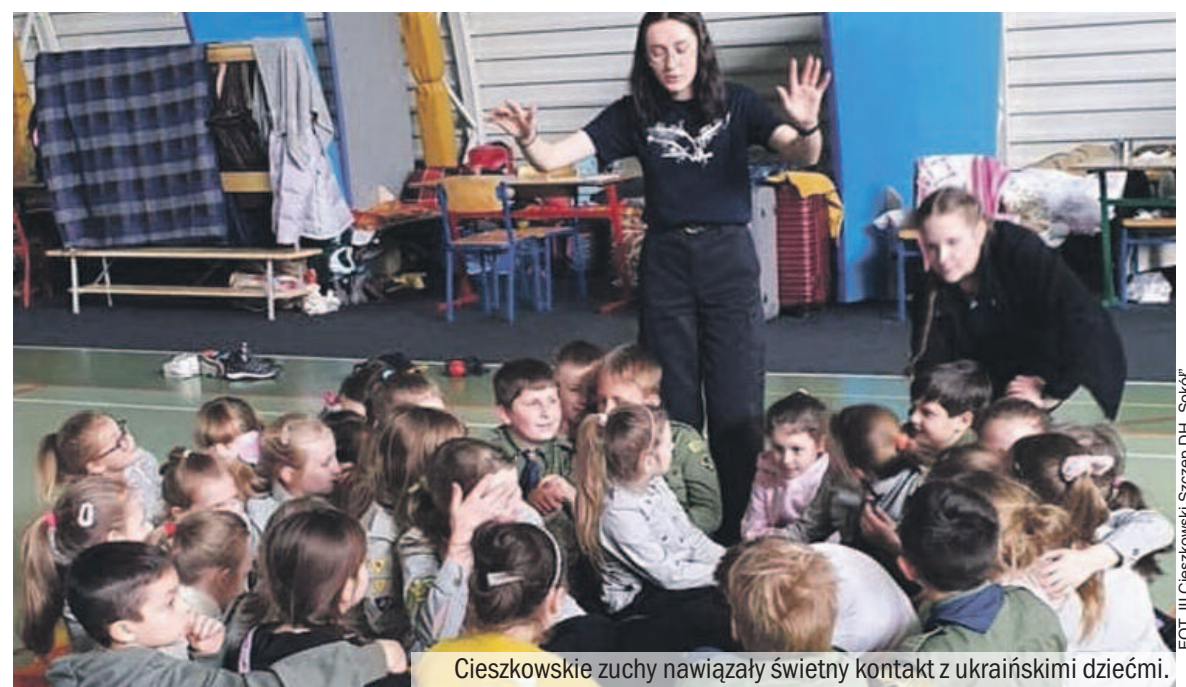
Cieszkowskie zuchy nawiązały świetny kontakt z ukraińskimi dziećmi.