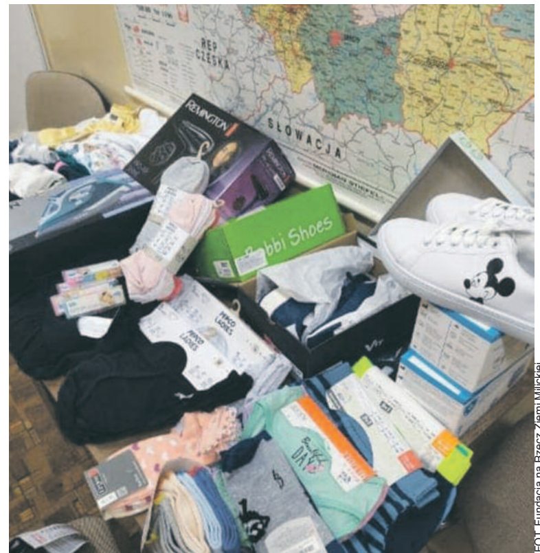
Za pieniądze ze zbiórki przeprowadzonej w Goshen (stan Nowy York) zakupiono dla ukraińskich dzieci buty, bieliznę, piżamki itp.