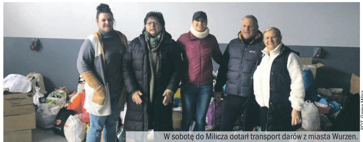
W sobotę do Milicza dotarł transport darów z miasta Wurzen.