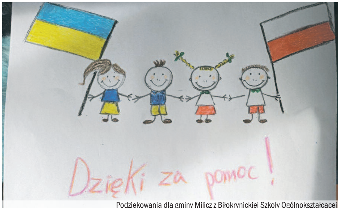
Podziękowania dla gminy Milicz z Biłokrynickiej Szkoły Ogólnokształcącej.