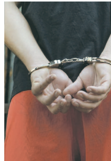
FOT. Zdjęcie poglądowe

– Tłum agresywnych sprawców próbował wtargnąć do budynku komendy, a interweniujący policjanci zostali obrzuceni kamieniami, kostką brukową z chodników, szklanymi butelkami czy jajkami. Zaatak-