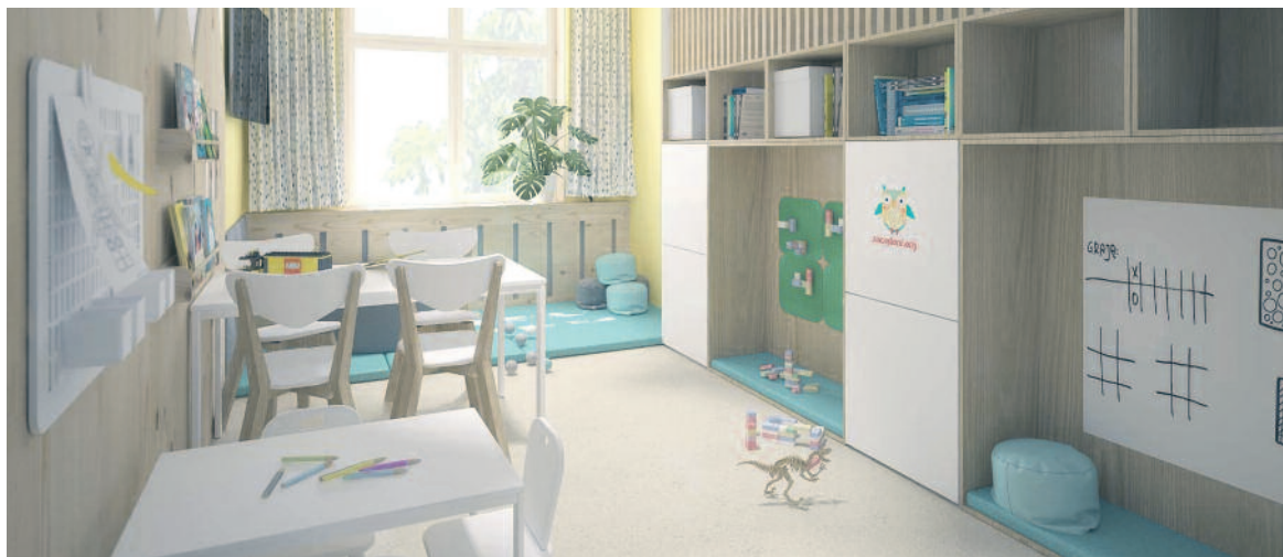
FOT. Pokoje Życzliwości

Milickie Centrum Medyczne poinformowało, że już wkrótce świetlica oddziału dziecięcego przejdzie zupełną metamorfozę. A to za sprawą pozytywnie rozpatrzonego wniosku do wrocławskiego stowarzyszenia Pozytywne.com.