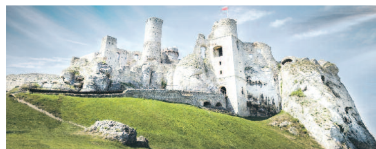
FOT. Zdjęcie poglądowe

Rządowy program „Poznaj Polskę” jest realizowany przez Ministerstwo Edu-