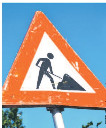
FOT. zdjęcie poglądowe

W październiku na terenie gminy Cieszków zakończono budowę chodnika na ulicy Polnej oraz prace na odcinku drogi krajowej nr 15. Ponadto dobiega końca przebudowa chodnika na ul. Kolejowej.