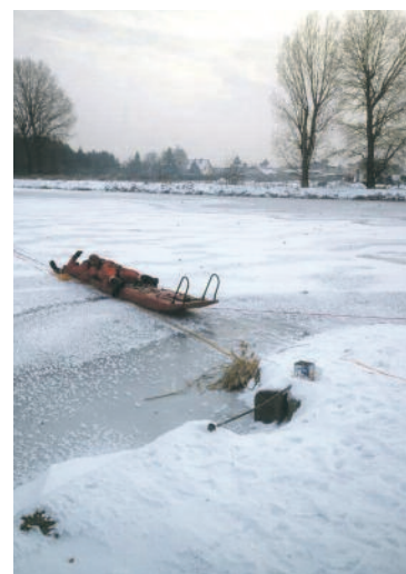
FOT. Zdjęcie poglądowe (JRG Krotoszyn)

W bieżącym sezonie zimowym 2022-2023 na terenie naszego kraju nie odnotowano utonięć osób w wyniku załamania się lodu. Niezależnie od tego pamiętajmy, że nieprzemysłane, lekkomyślne korzystanie z uroków zimy może zakończyć się tragicznie. Kontrolujmy, gdzie bawią się nasze dzieci. Uczulmy je na niebezpieczeństwo, jakie niesie ze sobą zabawa na zamrożniętych rzekach i jeziorach. Sprawdźmy, czy w razie potrzeby będą potrafiły wezwać