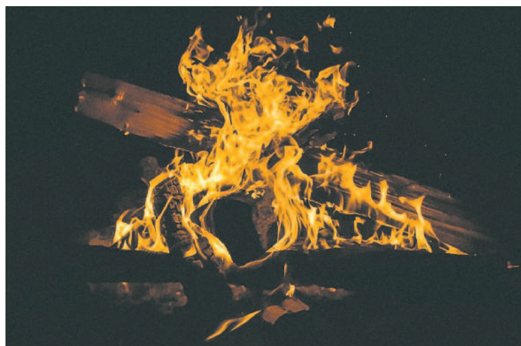
FOT. zażegnanie poglądowne

Trwa sezon grzewczy. W tym okresie wzrasta zagrożenie zatrucia czadem. Policja i straż pożarna ostrzegają przed jego zabójczym działaniem. Silny wiatr, brak odpowiedniej wentylacji pomieszczeń bądź niesprawne piecze opałowe czy piecyki gazowe często powodują poważne w skutkach zatrucia tlenkiem węgla.