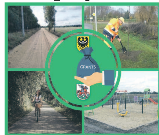
GRAFIKA - Gmina Milicz