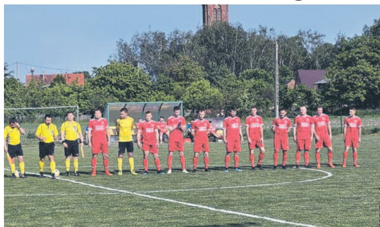
FOT. Plon Gądkowice

Na cztery kolejki przed końcem rozgrywek grupy II wrocławskiej A-klasy drużyna Plonu Gądkowice zapewniła sobie awans do okręgówki. Nasz zespół w 26. serii spotkań pokonał 5:1 Spartę Skarszyn.