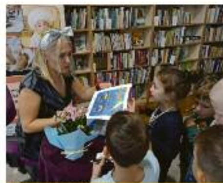
Rozdów Bajanki nie było końca!