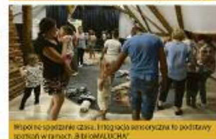
Współnie spędzanie czasu. Filozofia sensoryczna to podstawa spotkań w ramach „BIBLIOMALUCH”!

Biblioteka Publiczna Gminy i Miasta Zduny ul. Sienkiewicza 9 63-760 Zduny