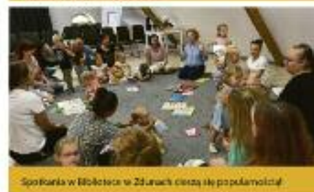
Spotkania w Bibliotece w Zdunach cieszą się popularnością!