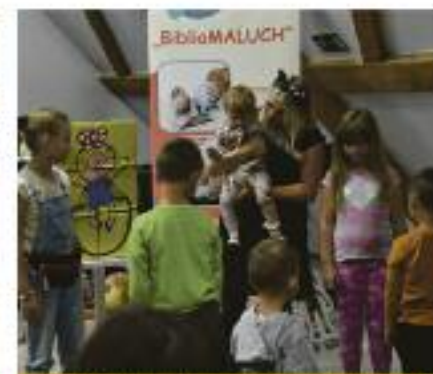
Bajania słodko, lecz najbardziej od plawozych miłośników spotkań!