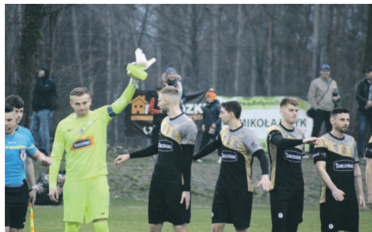
w zdobyciu goli i to nasz zespół wyszedł zwycięsko z tej konfrontacji. Po tej wygranej Barycz Sułów zmniejszyła stratę