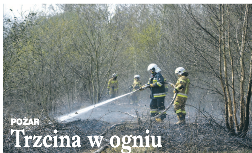
POŻAR Trzcina w ogniu

31 marca w miejscowości Nowy Zamek zapaliła się trzcina. Na miejsce skierowano po dwa zastępy z KP PSP i OSP w Miliczu oraz po jednym z kilku okolicznych jednostek OSP.